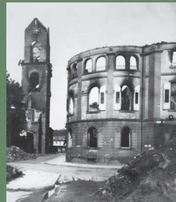
Der zerstörte Landtag, um 1947