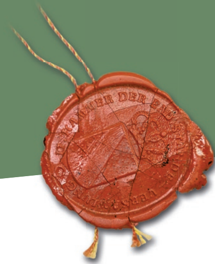
Lacksiegel der Zweiten Kammer der badischen Ständeversammlung, 1822 GLA Karlsruhe

Die demokratiegeschichtliche Ausstellung wählt verschiedene Perspektiven: Sie schildert zentrale Ereignisse, bietet aber auch regionale und biografische Zugänge zum Thema – und sie übergibt auch nicht die vielfältigen Widerstände und zahlreichen Gegenspieler, bis hin zur Zerstörung der Demokratie und der Beseitigung der Menschenrechte in der NS-Willkürherrschaft. Das Thema der Geschlechterverhältnisse findet seinen Niederschlag in einer Abhandlung über das Frauenwahlrecht.